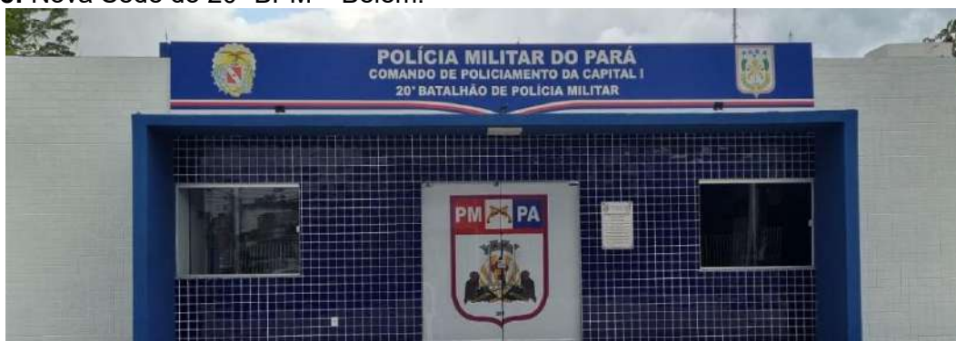
Figura 08: Nova Sede do 20º BPM – Belém.