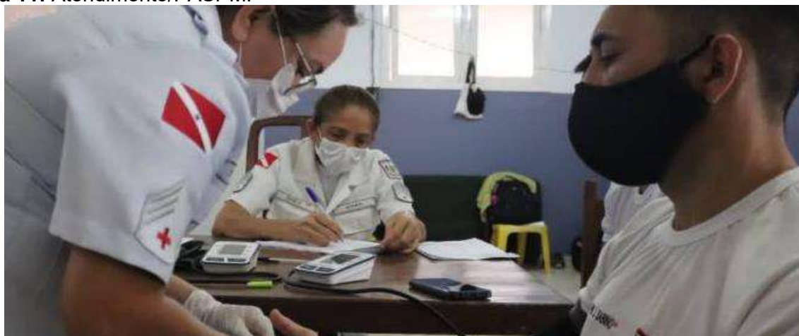
Figura 11: Atendimento/PASPM.

seguintes categorias profissionais: médico, dentista, fisioterapeuta, psicólogo, assistente social, enfermeiro, nutricionista, técnico de enfermagem e educador físico.