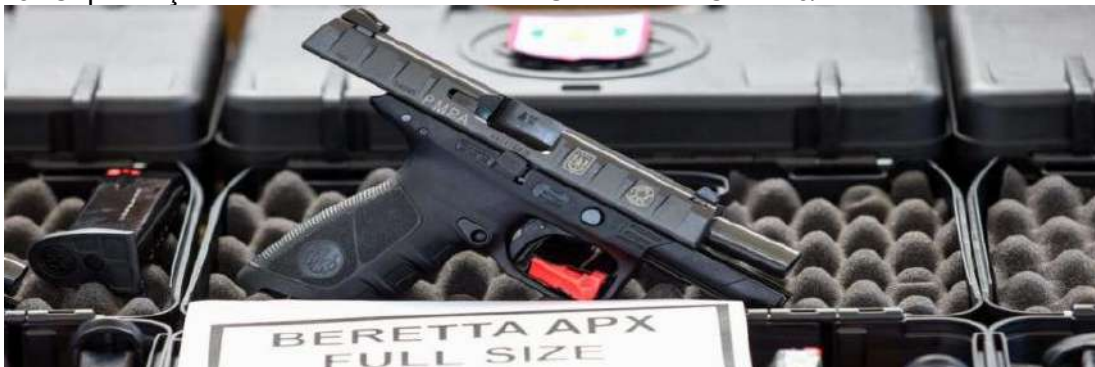
Figura 13: Capacitação Pistola BERETTA APX FULL SIZE – CAL. 40/

Em 2022 a Polícia Militar do Pará realizou marco histórico de 16.419 (dezesesseis mil quatrocentos e dezenove) capacitados, com destaques para os cursos realizados abaixo: