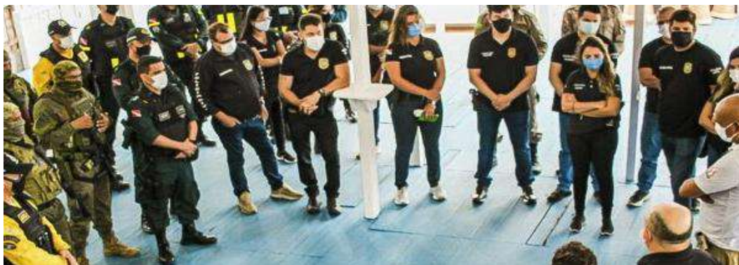
Figura 23: Operação Verão Seguro 2022

Encerrando o ciclo do primeiro semestre, houve a Operação CORPUS CHRISTI 2022 , ocorrida no período de 15 a 20 JUN 2022, empregando 219 Policiais Militares, para promover a Segurança Pública no Estado do Pará, através do Policiamento Ostensivo Geral nos municípios e em todas as áreas que sofram os efeitos por ocasião do feriado prolongado.