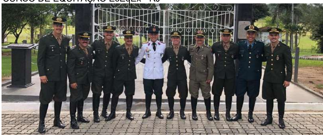
Figura 20: CURSO DE EQUITAÇÃO EsEqEx - RJ