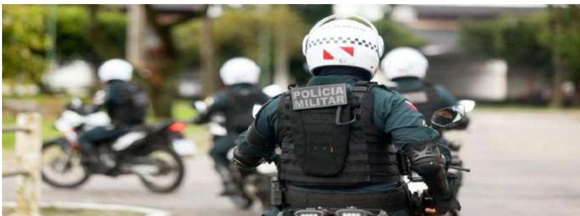
Figura 36: Reajuste do Soldo 2022

Em 2022 além da equiparação dos soldos ao salário mínimo vigente, que marca um ato histórico para a categoria dos praças da PM. Houve também reajuste salarial médio de mais 40% para as categorias militares em 2022, em comparação a 2018.