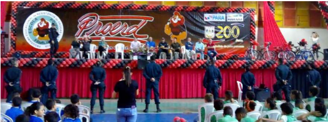
Figura 33: Encerramento do PROERD em Marabá.