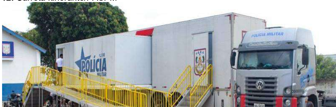
Figura 12: Carreta Itinerante/PASPM