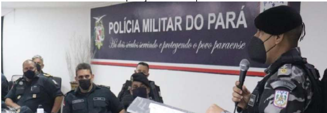
Figura 17: Formatura do VI Curso de Operações de Choque 2022 – VI COPC