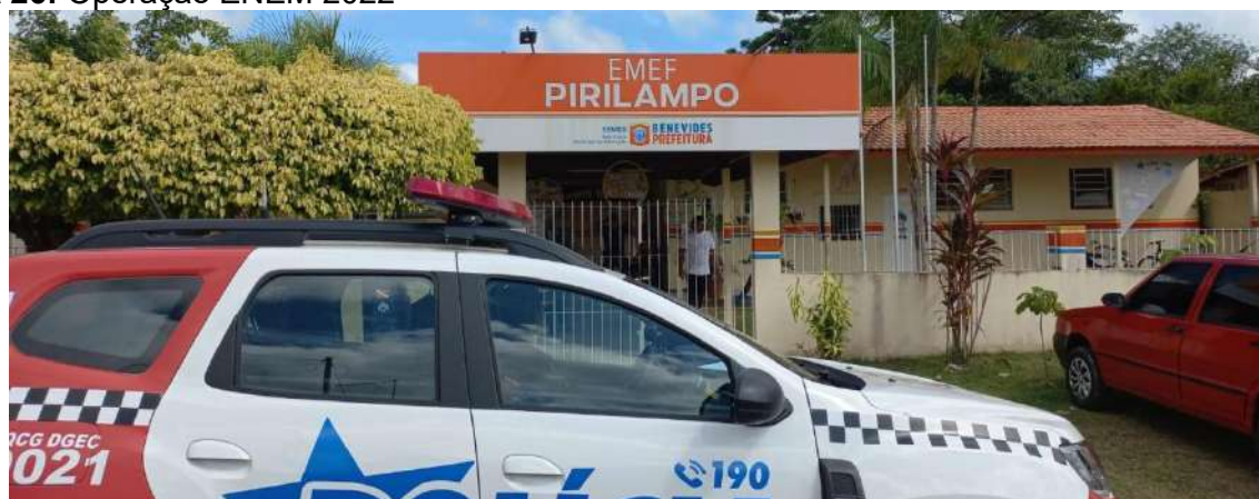
Figura 26: Operação ENEM 2022