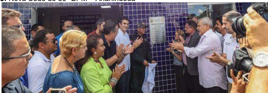
Figura 05: Nova Sede do 30º BPM – Ananindeua