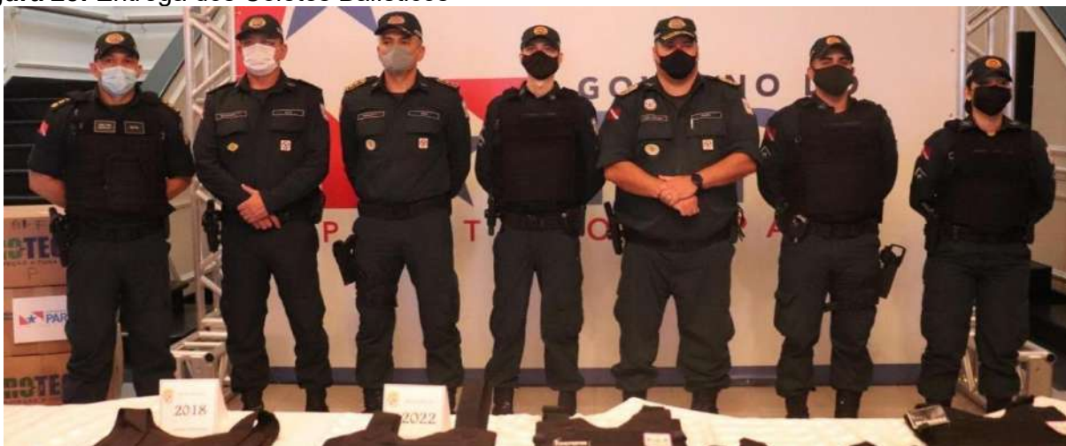
Figura 28: Entrega dos Coletes Balísticos

utilizados até 2018. Com essa entrega, completamos 18 mil coletes balísticos, atendendo assim 100% da nossa tropa incluindo os 2.785 novos policiais. E sobre a aquisição desses equipamentos, é importante destacar que pelo menos 15 Estados da federação aderiram à ata de aquisição elaborada pela nossa equipe técnica de licitação da PMPA.