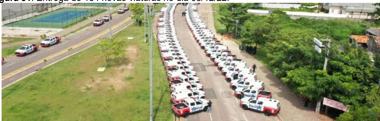
Figura 31: Entrega de 134 novas viaturas no dia 05/12/22.

A Polícia Militar mudou sua estrutura organizacional criando uma Diretoria de Projetos e Convênios, desenvolvendo a estratégia para incrementar o orçamento da Corporação por meio da Captação de Recursos dentro e fora do estado, com o fito de aparelhar e modernizar a instituição, recebendo da Secretaria de Segurança Pública e Defesa Social - SEGUP, a transferência de armamentos, equipamentos, munições, mobília e semoventes que somam o valor de R$ 30.128.624,32; e por meio de 10 (dez) emendas parlamentares recebeu equipamentos, materiais diversos e realizou cursos para os policiais militares com valor de R$ 667.566,60 e por fim com os convênios com o INEP, BACEN, DETRAN, MPPA, TJPA e MPC recebe recursos no valor de R$ 10.517.680,53, os quais totalizam R$ 41.313.871,45 .