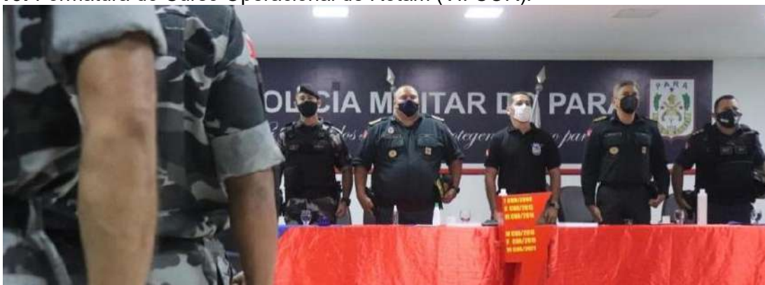
Figura 15: Formatura do Curso Operacional de Rotam (VII COR).