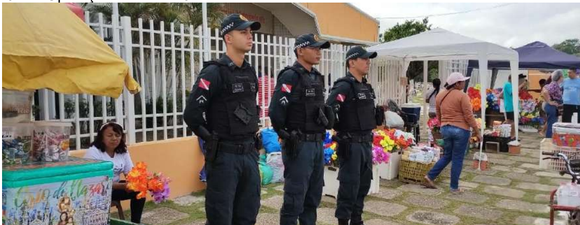
Figura 24: Operação Finados 2022

regular os procedimentos adotados pela Polícia Militar por ocasião do período do mês de dezembro, com abrangência em todo o Estado do Pará, orientando o emprego de metodologias, recursos e tecnologias no policiamento preventivo e repressivo.