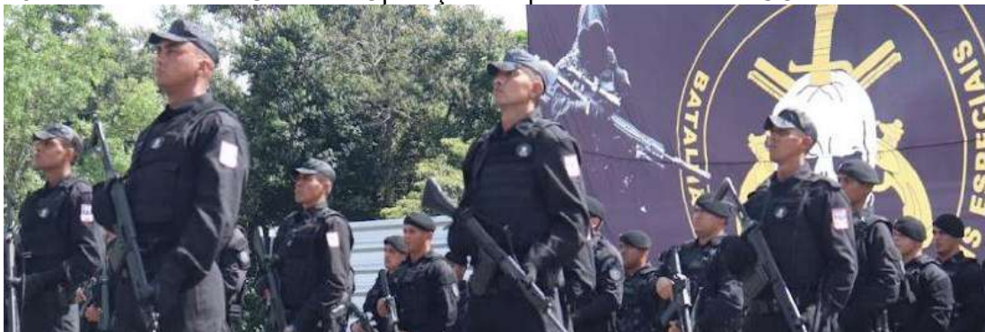
Figura 16: Formatura do IV Curso de Operações Especiais da PMPA – COESP