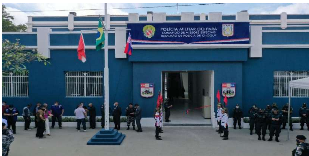
Figura 01: Reforma do Comando de Missões Especiais – CME.

**** Conforme Termo de Execução Descentralizada - TED nº 002/2020 - DETRAN/PMPA, tendo como meta a reforma de 08 (oito) Postos do Batalhão de Polícia Rodoviária nos municípios de: Moju, Tomé Açu, Aurora do Pará, Conceição do Araguaia, Paragominas, Ourém, Goianésia e Tailândia e a construção do Posto Rodoviário de Marituba e o 20° BPM construído pelo Fundo Estadual de Segurança Pública - FESP/PA.