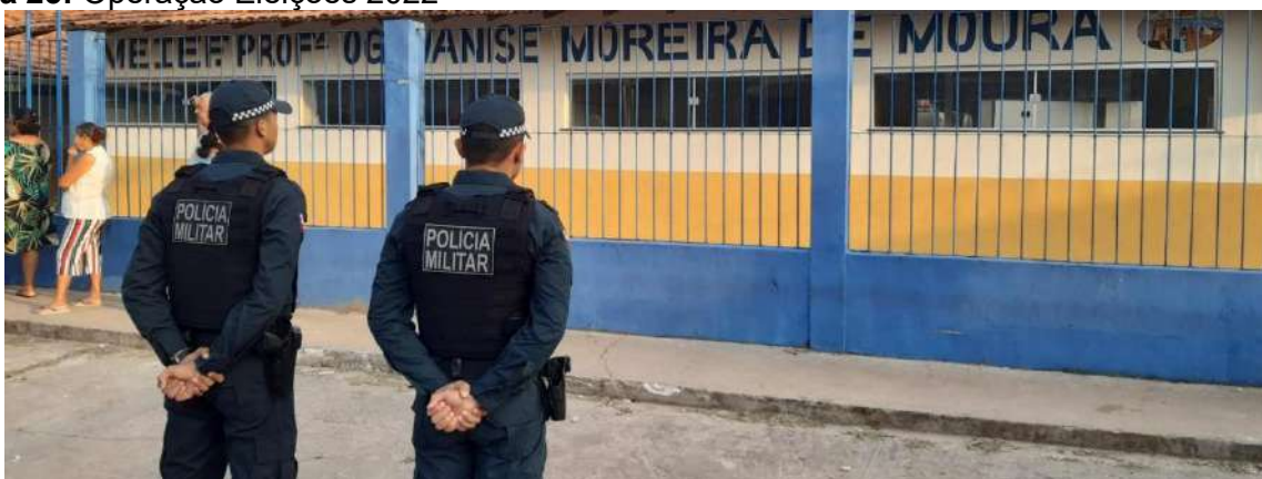
Figura 25: Operação Eleições 2022