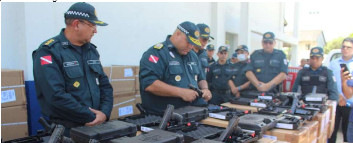
Figura 29: Entrega Pistolas Beretta Semiautomáticas CAL.40 S&W