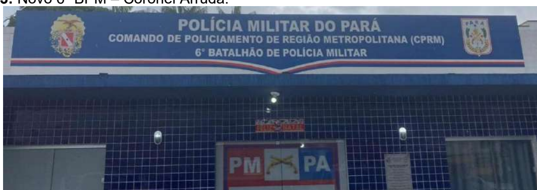
Figura 03: Novo 6º BPM – Coronel Arruda.