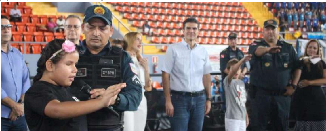
Figura 34: Encerramento do PROERD em Belém: