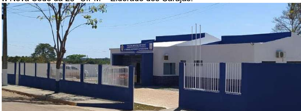
Figura 04: Nova Sede da 25ª CIPM – Eldorado dos Carajás.