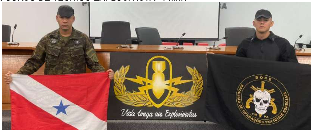
Figura 21: CURSO DE TÉCNICO EXPLOSIVISTA - PMMT