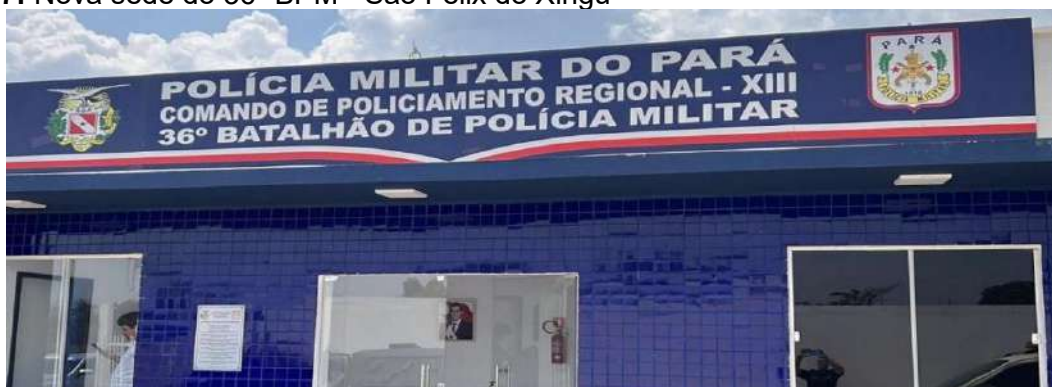
Figura 07: Nova sede do 36º BPM - São Félix do Xingu