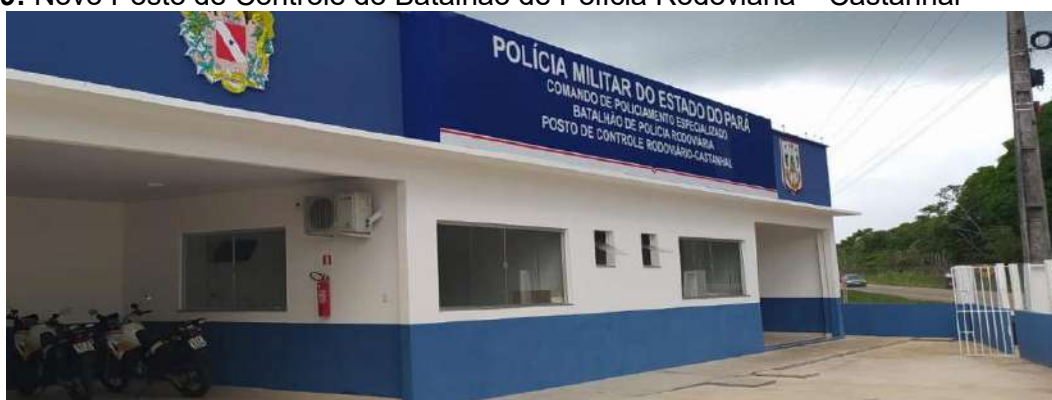
Figura 09: Novo Posto de Controle do Batalhão de Polícia Rodoviária – Castanhal