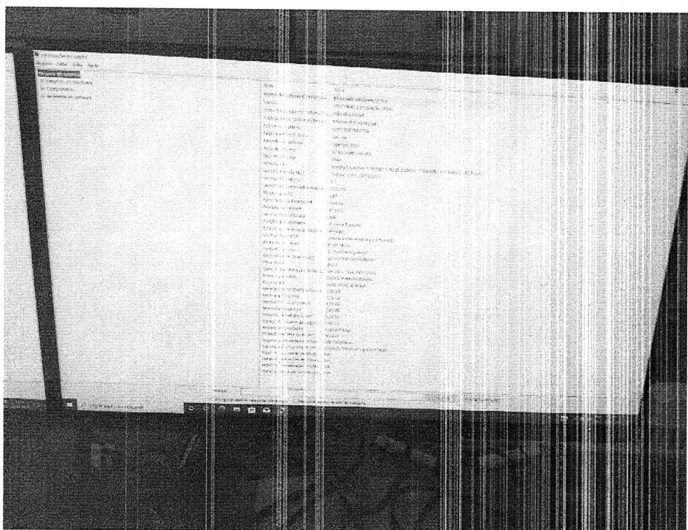
Figura III: KIT COMPUTADOR DESKTOP EM FUNCIONAMENTO / ESPECIFICAÇÕES TÉCNICAS.