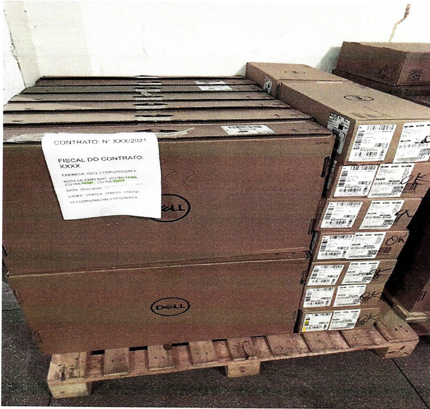
Figura I: KIT COMPUTADOR DESKTOP NA CAIXA E LACRADO