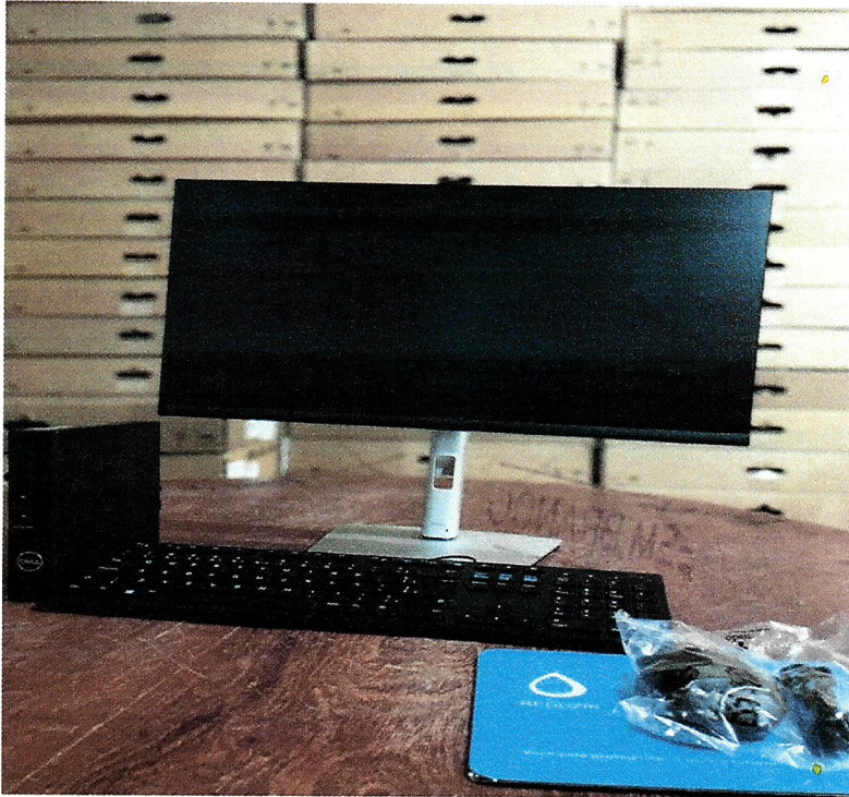
Figura II: KIT COMPUTADOR DESKTOP EM FUNCIONAMENTO COM ACESSÓRIOS (MOUSE E TECLADO)