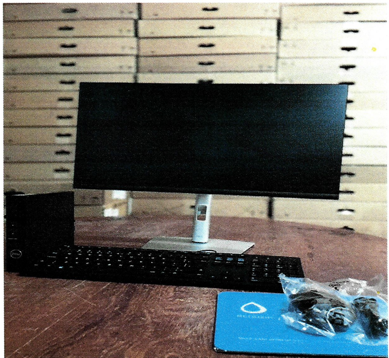
Figura II: KIT COMPUTADOR DESKTOP EM FUNCIONAMENTO COM ACESSÓRIOS (MOUSE E TECLADO)