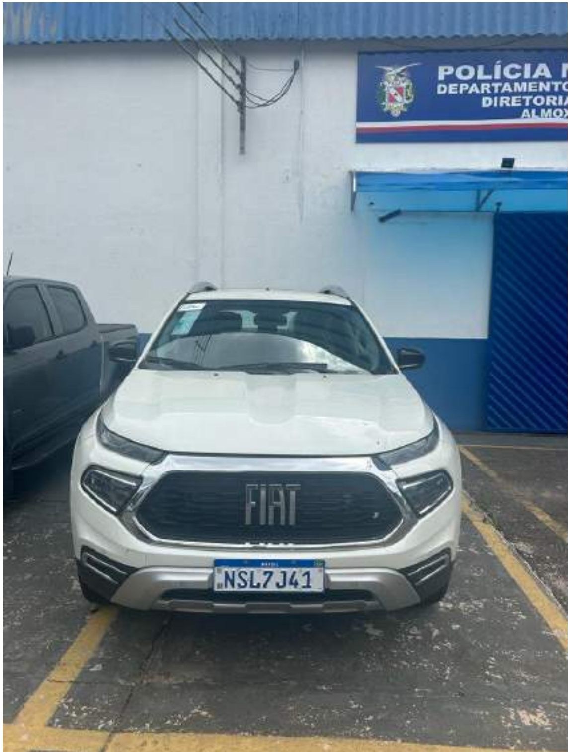
Figura I: Veículo tipo PICK UP 4X4, cabine dupla